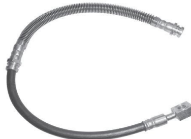
1810 OK 72F43810-C Besta GS-1998/2000 Dianteiro