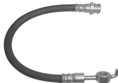
1802 8.416.348 Topic / Besta Dianteiro - 320 mm