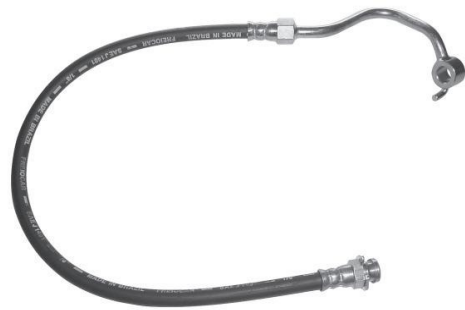
1137 Flex.F.H. Micro-Ônibus Volare - Lado Esquerdo