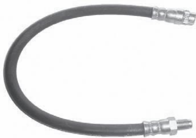
1527 RE 00328 Trafic - 383 mm