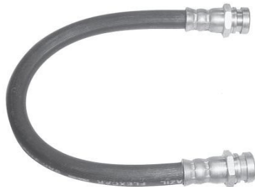
1805 5881143001 Hunday H-100 Intermediário Dianteiro - 300 mm