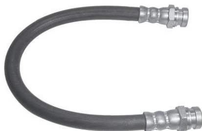
1801 7.910.349 Topic / Besta Traseiro - 297 mm