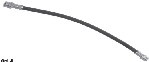
1814 MR 129795 Mitsubishi L-200 Traseiro