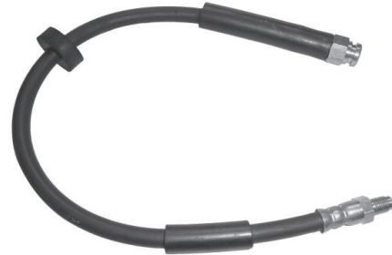
1812 1325030080 Ducato Dianteiro