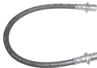
1804 AA 10043820 Towner Traseiro - 405 mm