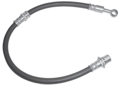
1803 AA 10043810 Towner Dianteiro - 510 mm