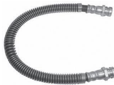
1806 5881143002 Hunday H-100 Intermediário Traseiro - 342 mm