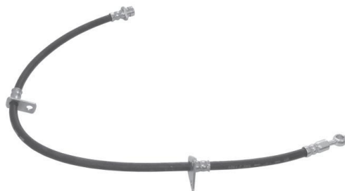
1818 OSK-52011 Honda Civic - Freio Hidráulico