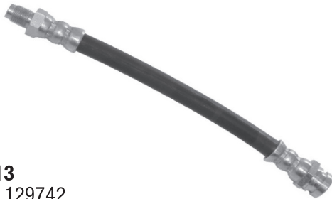
1813 MR 129742 Mitsubishi L-200 Dianteiro