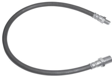
1616 93.817.105 Iveco Dailw 3510 / 4910 / 4912