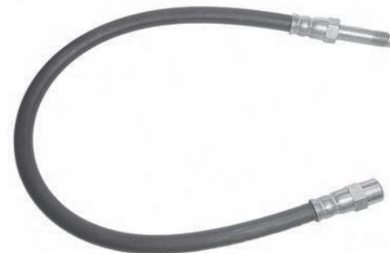
1919 690.428.7235 Sprinter - 485 mm