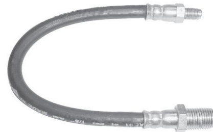
1617 93.822.394 Iveco Dailw 3510 / 4910 / 4912