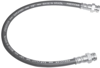
1811 Embregem Topic