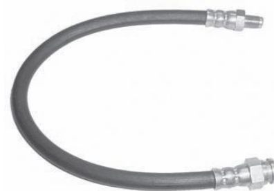
1808 3524309 Embreagem Besta / H 100