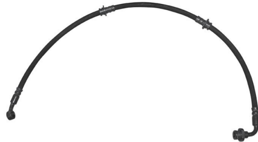
1820 Flexível Freio Jeep Suzuki Vitara - Dianteiro 800 mm p.p.