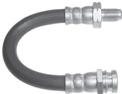
1807 Hunday H-100 - do tubo à pinça - 185 mm