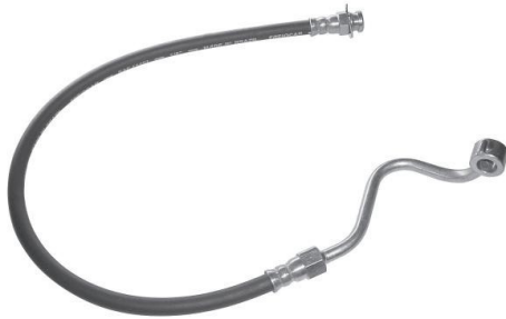
1136 Flex. F.H. Micro-Ônibus Volare Lado Direito