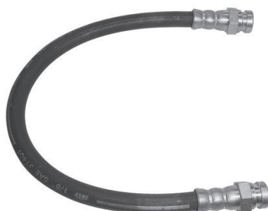
1809 Topic - 330 mm