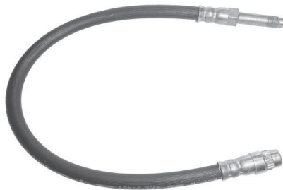
1918 690.428.7135 Sprinter - 430 mm