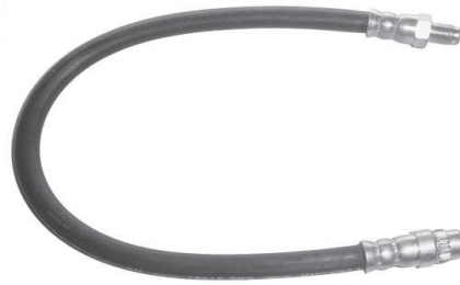
1528 RE 00347 Trafic - 425 mm