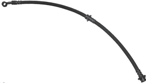
1819 Flexível Freio Jeep Suzuki Vitara - Traseiro 550 mm p.p.